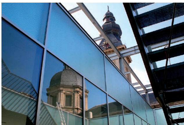
nieuwbouw Faculteit Economie en Bedrijfskunde, UGent

Het niveau van voorkennis is dat van een architect, industrieel of burgerlijk ingenieur met basiskennis in één van de deeldomeinen (architectuur/bouwkunde, werktuigkunde, elektrotechniek), die zich wil bijscholen in het brede domein dat verband houdt met energieprestaties van gebouwen. Van de cursisten wordt verwacht dat zij notie hebben van EPB (bijvoorbeeld